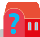
Neue Projekte Hauptamt