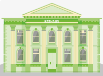
Politik & Verwaltung