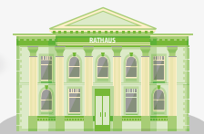
Politik & Verwaltung