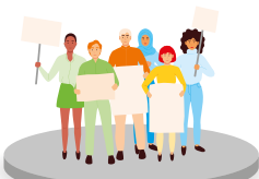
Kampagnen und Meinung