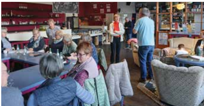
Teilnehmende im Austausch: Gemeinsam entwickeln sie neue Ideen für ein aktives und solidarisches Älterwerden

Ein weiterer Teil des Workshops war die Frage, welche Erfahrungen die Teilnehmenden selbst einbringen möchten. „Wir möchten ein Netzwerk von Älteren für Ältere aufbauen, das über das Projektende hinaus Bestand hat“, so das LiA-Team. Möglich ist vieles: teilnehmen, eigene Fähigkeiten teilen oder sogar neue Gruppen ins Leben rufen – jeweils mit Unterstützung des Teams. Aus dem Workshop entstanden neue Angebote wie eine Papierfalt-Gruppe, eine Walking-Gruppe und ein Kunstprojekt zwischen Jung und Alt, das gemeinsam mit der Universität Witten/Herdecke und der Belia Seniorenresidenz im Herbst umgesetzt wird. Aktuell werden zudem Ideen aus dem ersten Workshop in Gevelsberg realisiert: ein Instrumente-Probier-Workshop sowie Seminare zu KI und Gesundheitsvorsorge. Parallel laufen Digitalcafés im Kreis, und Kooperationen mit lokalen Unternehmen und Wohnungsbaugenossenschaften werden weiter ausgebaut.