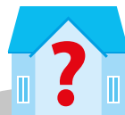
Neue Projekte Ehrenamt