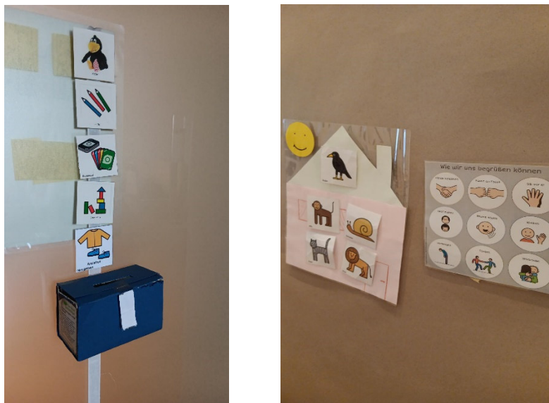
Strukturierung nach TEACCH, ggf. mit GuK Gebärden

Um den Kindern eine Möglichkeit der Beteiligung zu geben, werden die Wünsche der Kinder durch niederschwellige gemeinsame Regeln und Wünsche ausgestaltet. Zudem werden Emotions-Uhren (siehe Fotos) oder –Karten eingesetzt, welche auch eine kindgerechte Reflexion der Förderstunden ermöglichen. So können die Kinder an niederschweligen Beschwerdeverfahren beteiligt werden. Grundsätzlich folgen die Förderstunden einer Strukturierung, an welcher die Kinder immer beteiligt werden. Diese Strukturierung wird für Kinder auch visuell dargestellt, so dass sie immer wissen, was als nächstes folgt und dies auch mitbestimmen können (TEACCH Ansatz) (siehe Fotos). Zum Teil wird dies durch TimeTimer unterstützt, damit die Kinder auch ein Zeitgefühl entwickeln. Viele Mitarbeiter*innen greifen zum Teil auf Ampel-Systeme zurück, um so den Kindern eine niederschwellige und kindgerechte Reflexionsmöglichkeit zu geben.