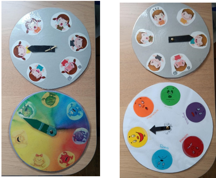
Beispiele für Gefühlsuhren